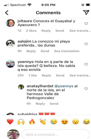
Figura 3. Comentarios seguidores.