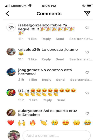
Figura 2. Opiniones seguidores.