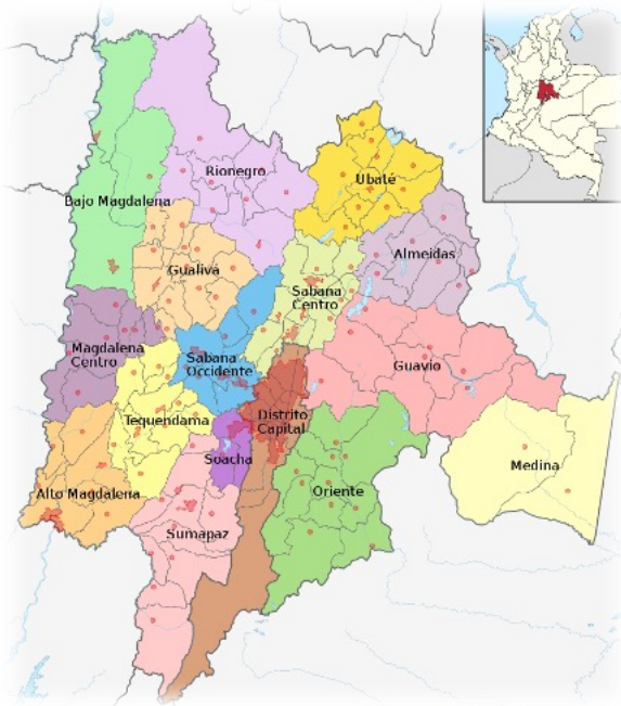
Figura 1. Provincias

La Provincia en el país de Colombia, se considera como la división intermedia entre un departamento y el municipio cercano, los orígenes de provincia se pueden observar con más detalle en las constituciones de 1811, 1832, 1843, y en la constitución de la Gran Colombia. En las 15 provincias que tienen Colombia; nos ubicamos en el Departamento de Cundinamarca, el cual se agrupa en 116 Municipios, incluyendo su capital; Distrito Capital, Bogotá. Aquí nos encontramos con la provincia del Tequendama el cual lo conforman los municipios de: Anapoima, Anolaima, Apulo, Cachipay, El Colegio, La Mesa, Quipile, San Antonio del Tequendama, Tena y Viotá conformando un total de 10 municipios con un promedio de 160.000 habitantes aproximadamente, con tierras que contienen los diferentes pisos térmicos y donde la base de la economía es el sector agropecuario.