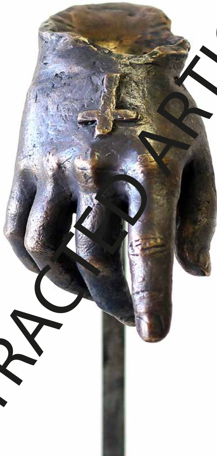
Figura 7. Propuesta artística de Alicia Busto Rodríguez de una mano fundida en bronce