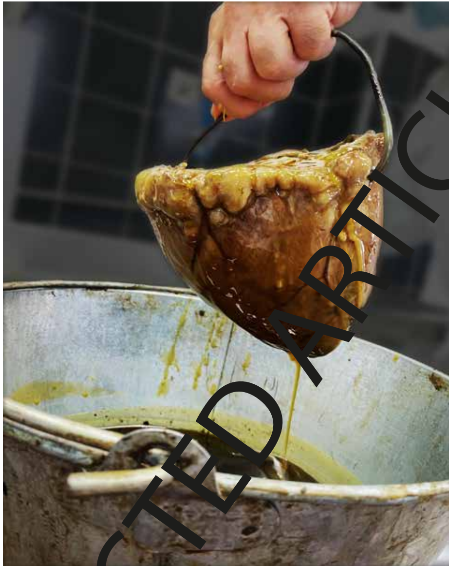
Figura 5. Inmersión del corazón en cera líquida para la construcción del molde de cera