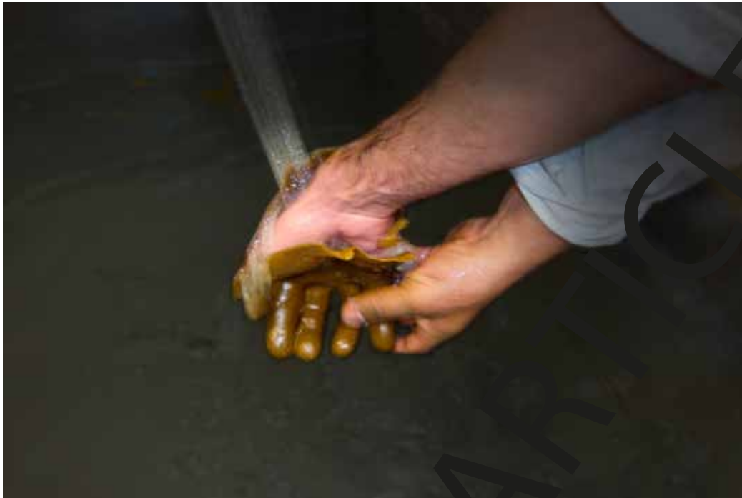
Figura 3. Desmolde de la mano de un molde de cera