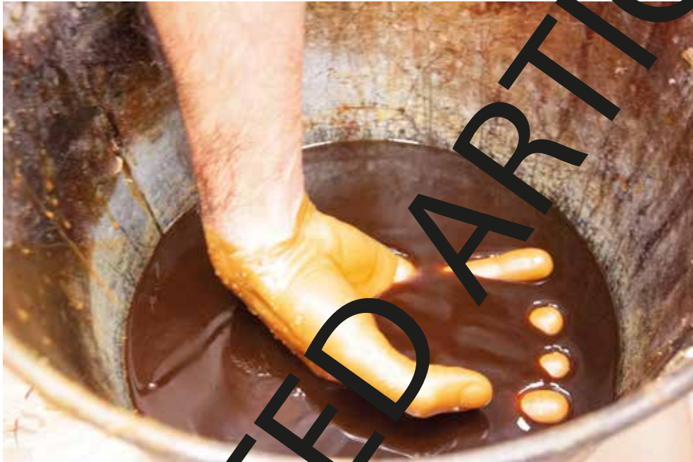
Figura 2. Construcción del molde de cera por inmersión de una mano