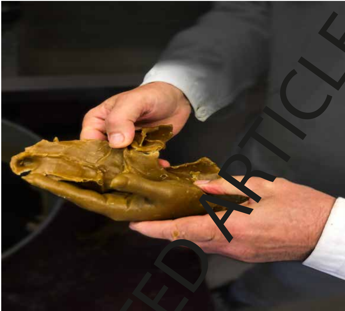
Figura 4. Obtención de la reproducción de la mano en cera