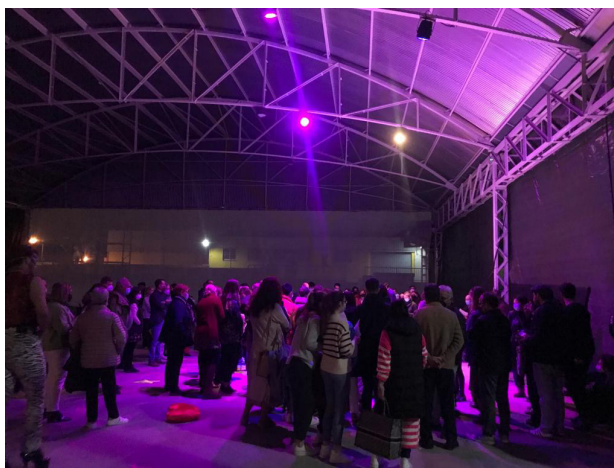
Figura 5. Presentación espectáculo y público

En la figura 5, se puede apreciar el espacio ocupado por el público e iluminado en el momento del espectáculo.