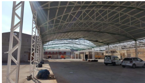
Figura 2. La Cebera