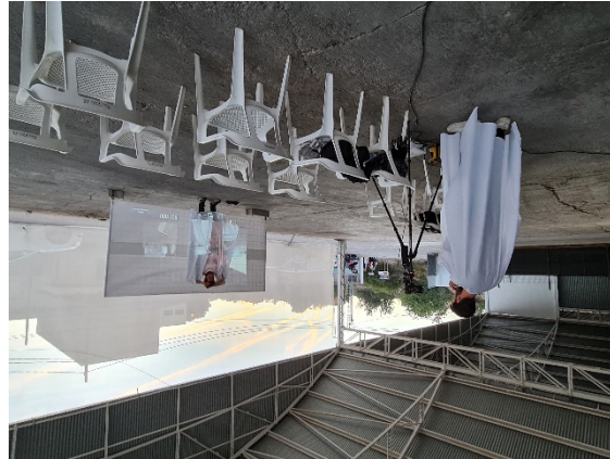
Figura 3. Ensayos