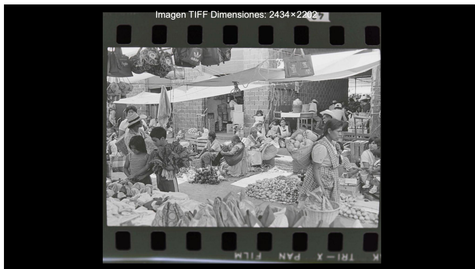
Figura 9. Categoría-Entre marchantes