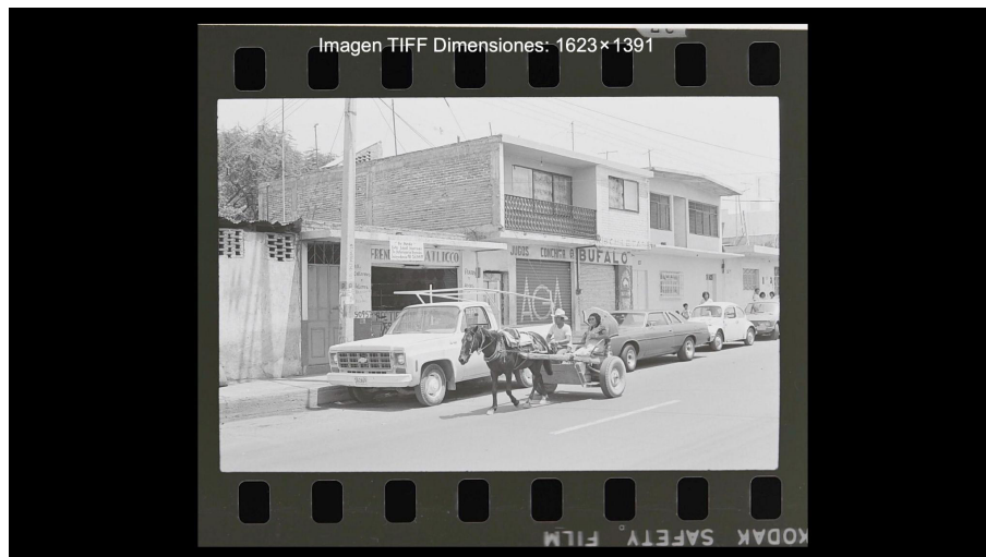
Figura 8. Categoría - De camino

Fuente: Fondo Ralph Harland Cake del Laboratorio Universitario de Imagen y Memoria. BUAP, 16 de junio de 1982.