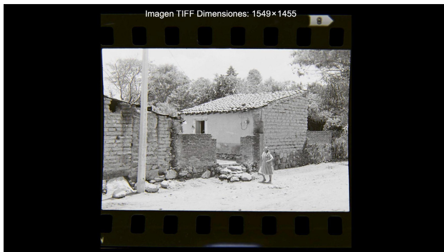
Figura 6. Categoría - Nuestro hogar

Fuente: Fondo Ralph Harland Cake del Laboratorio Universitario de Imagen y Memoria. BUAP, 24 de junio 1981.