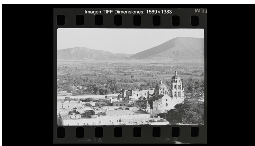
Figura 5. Categoría - Caminando con la fe

Fuente: Fondo Ralph Harland Cake del Laboratorio Universitario de Imagen y Memoria. BUAP, 22 de enero 1973.