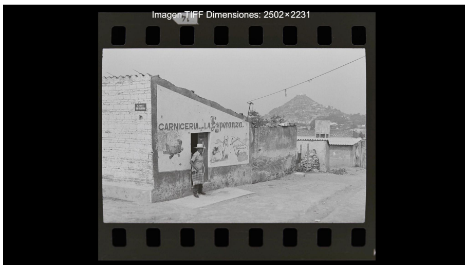
Figura 7. Categoría - La esperanza

Fuente: Fondo Ralph Harland Cake del Laboratorio Universitario de Imagen y Memoria. BUAP, 12 de mayo de 1982.